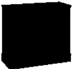
A-KOM2 wys.806 szer.1029 gł.447