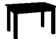
A-STÓŁ1 wys.740 szer.900 gł.1300

Niniejsza oferta nie jest ofertą w rozumieniu Kodeksu Cywilnego. Producent zastrzega sobie prawo do dokonywania zmian konstrukcyjnych w oferowanych modelach mebli, nie zmieniając ich ogólnego charakteru. Kolorystyka oraz wymiary modułów mogą w rzeczywistości nieznacznie różnić się od prezentowanej w folderze.