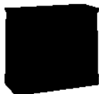
A-KOM1 wys.806 szer.1029 gł.447