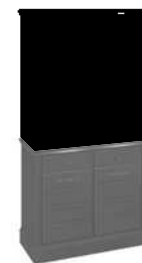
A-WIT5 wys.1100 szer.1034 gł.410