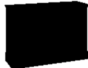
A-KOM3 wys.806 szer.1328 gł.447