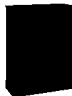
A-KOM6 wys.1248 szer.1029 gł.447